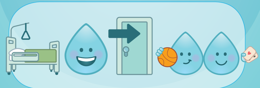
POUR PARTICIPER À DES ACTIVITÉS COMMUNES

LES PARTENAIRES DE LA CAMPAGNE "VOUS ÊTES EN DE BONNES MAINS"