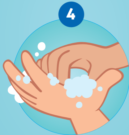
4 SE FROTTER LE BOUT DES DOIGTS, LES DEUX FACES DES MAINS...