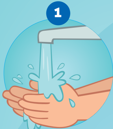
1 SE MOUILLER LES MAINS