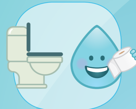
APRÈS ÊTRE ALLÉ AUX TOILETTES