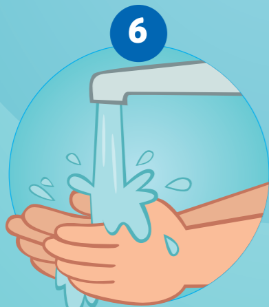
6 SE RINCER LES MAINS