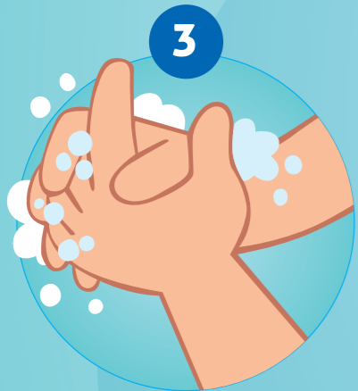
3 SE SAVONNER LES MAINS