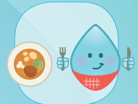
AVANT ET APRÈS AVOIR MANGÉ