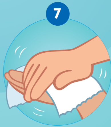
7 SE SÉCHER SOIGNEUSEMENT