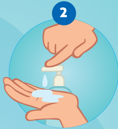
2 PRENDRE DU SAVON