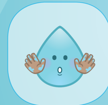
SI LES MAINS SONT SALES